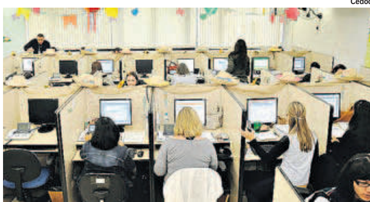
Call Center faz parte das 17 empresas que mais empregam

lou sobre data para votar o texto, mas disse que o Senado espera o prazo regimental de cinco sessões entre a aprovação pela Câmara, o que vai acontecer na próxima semana.